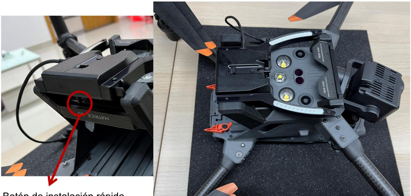
Botón de instalación rápida

2Mantenga presionado el botón de instalación rápida debajo de Bk30, luego pegue la base del dron desde arriba hacia abajo.