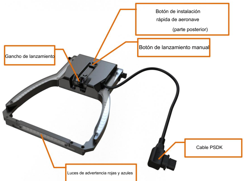
Figura 1 Diagrama de componentes de la caja de comunicación